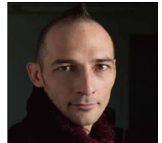
Perfumer Profile Christophe Laudamiel クリストフ・ラウダミエル

彼の香りの作品、演出は、世界中のファインフレグランスにおける幅広い分野で知られており、また、世界の革新的なイベントでも演出をしている。これまでにエスティ・ローダーの「White Linen, Pink Coral」やマイケル・コースの「London」などを手がけた。